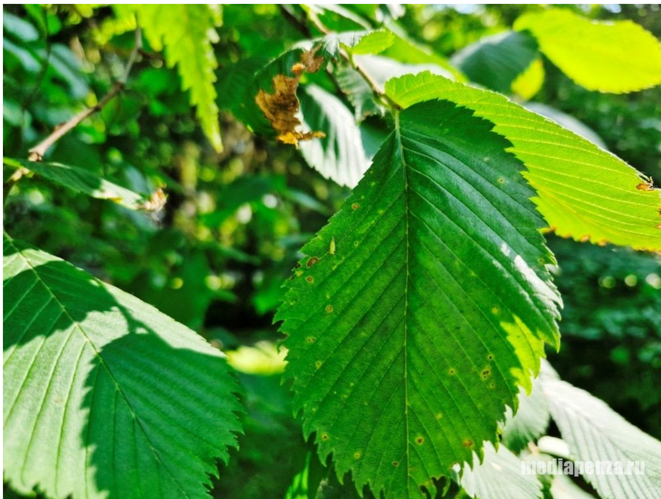
Ложногусеница на листе вяза