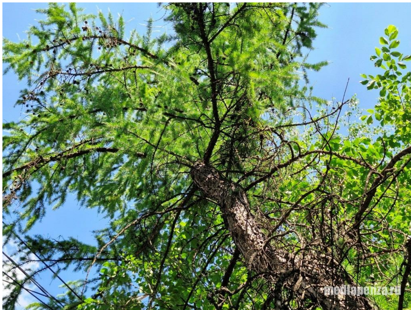
Лиственница в сквере у «Электромеханики»

Да и озеленение города явно должно включать в себя не только посадку новых саженцев, но и сохранение старых деревьев. В том же сквере на пересечении улиц Калинина и Свердлова, по оценкам МедиаПензы растут не менее двадцати видов деревьев и кустарников. Среди них – белая акация, берёза, вяз, груша, дейция, ель, жостер, клён, липа, лиственница, рябина, тополь, туя, чубушник, яблоня, ясень и др. При этом незначительное количество деревьев в сквере являются засохшими и их необходимо спилить. Вязы предположительно заражены вязовым зигзагообразным пилильщиком, личинки (ложногусеницы) которого выедают ткань листьев. Вредителями поражены и дикие яблони.