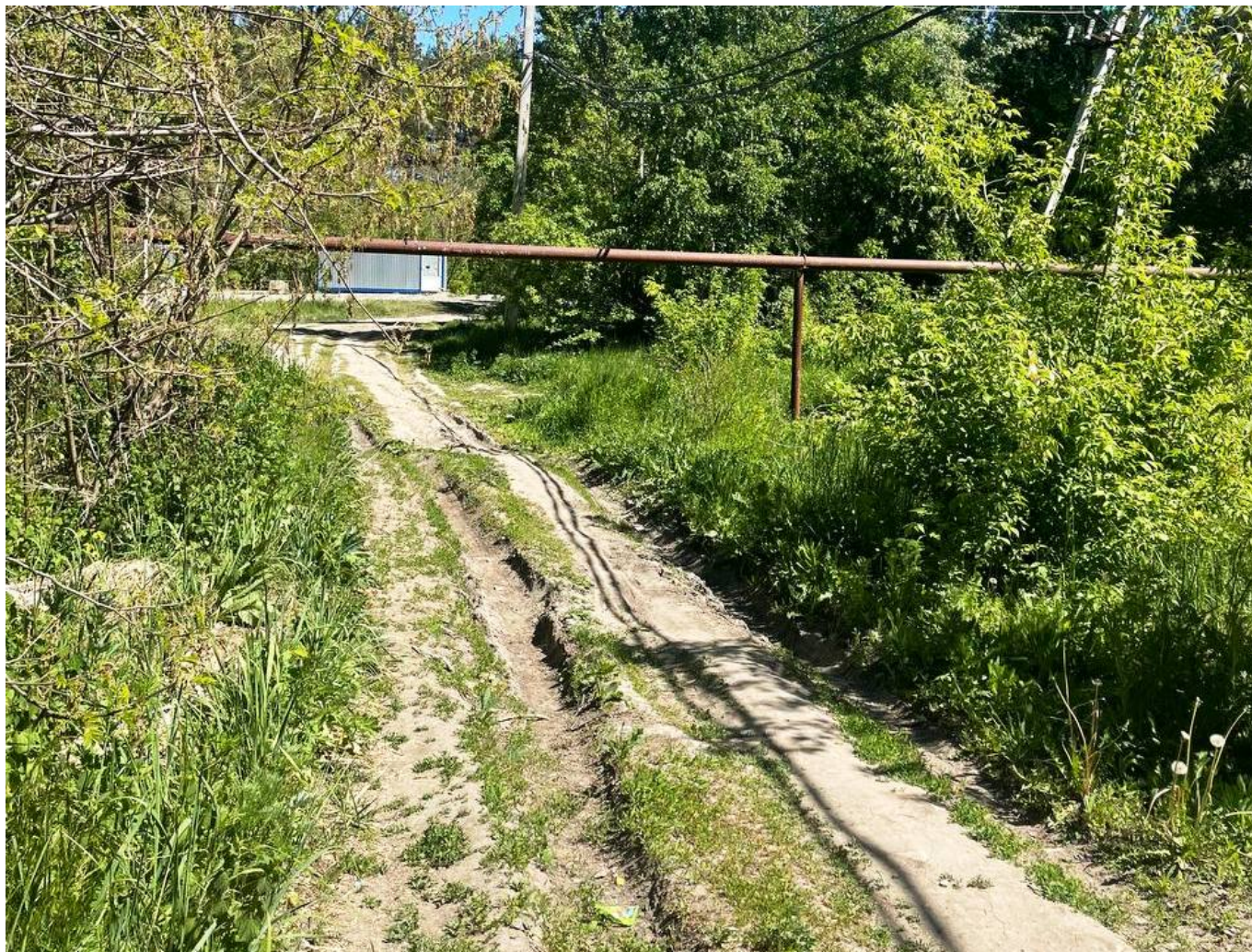
Та самая «прокатанная дорога»

Кроме того, итоговая дорога с этой колеёй пересекается лишь частично. По проектной документации под вырубку пошло около 400 деревьев, десятки сосен, но суд этим доводам иска оценки не дал, ограничившись констатацией того, что траектория была изменена ради сохранения части деревьев неизвестных пород в юго-восточной части сквера.