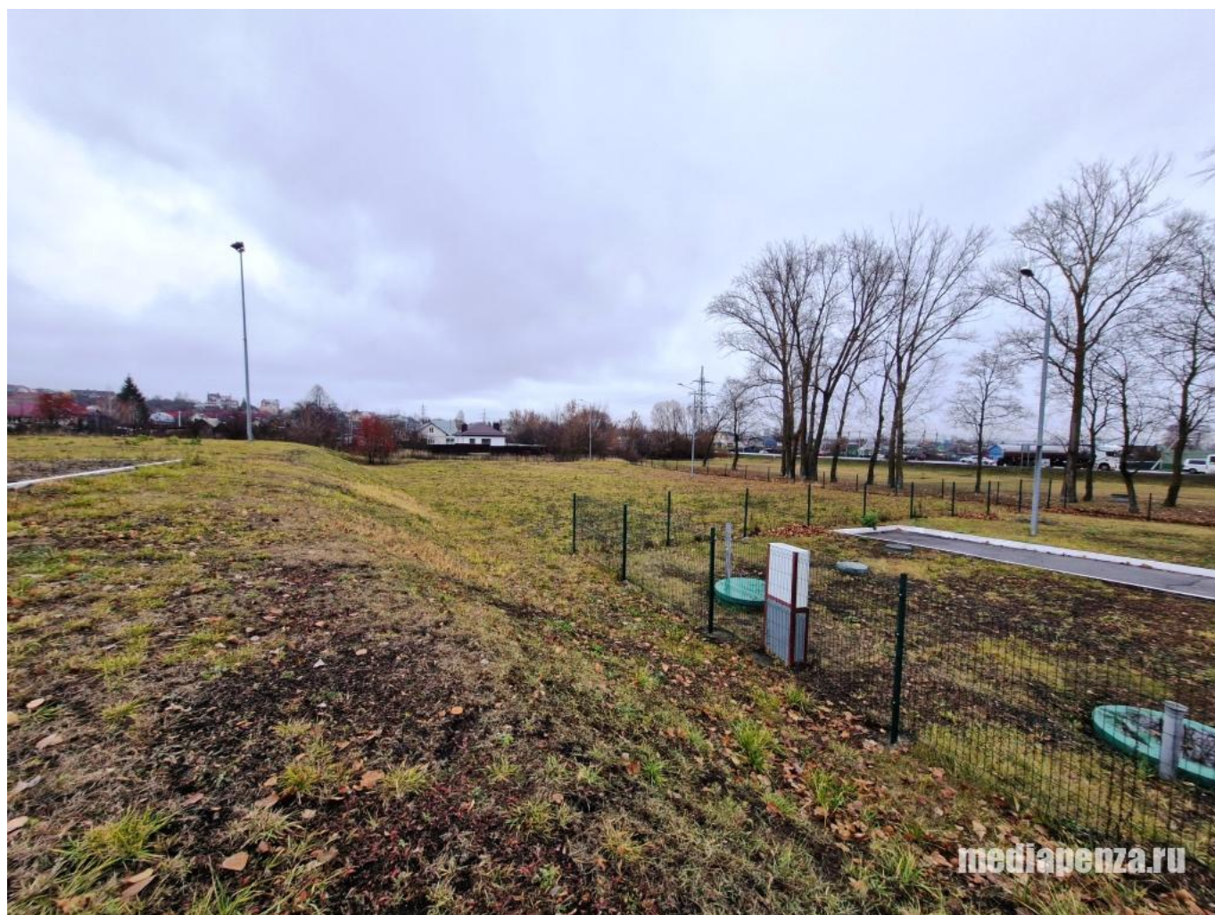
Сквер за дворцом единоборств «Воейков».

К примеру, в 2025 году такой площадкой мог стать сквер за дворцом единоборств «Воейков» на улице 40 лет Октября. Он набрал 3 336 голосов, то есть первое место среди всех общественных территорий, которые нельзя отнести к общегородским.