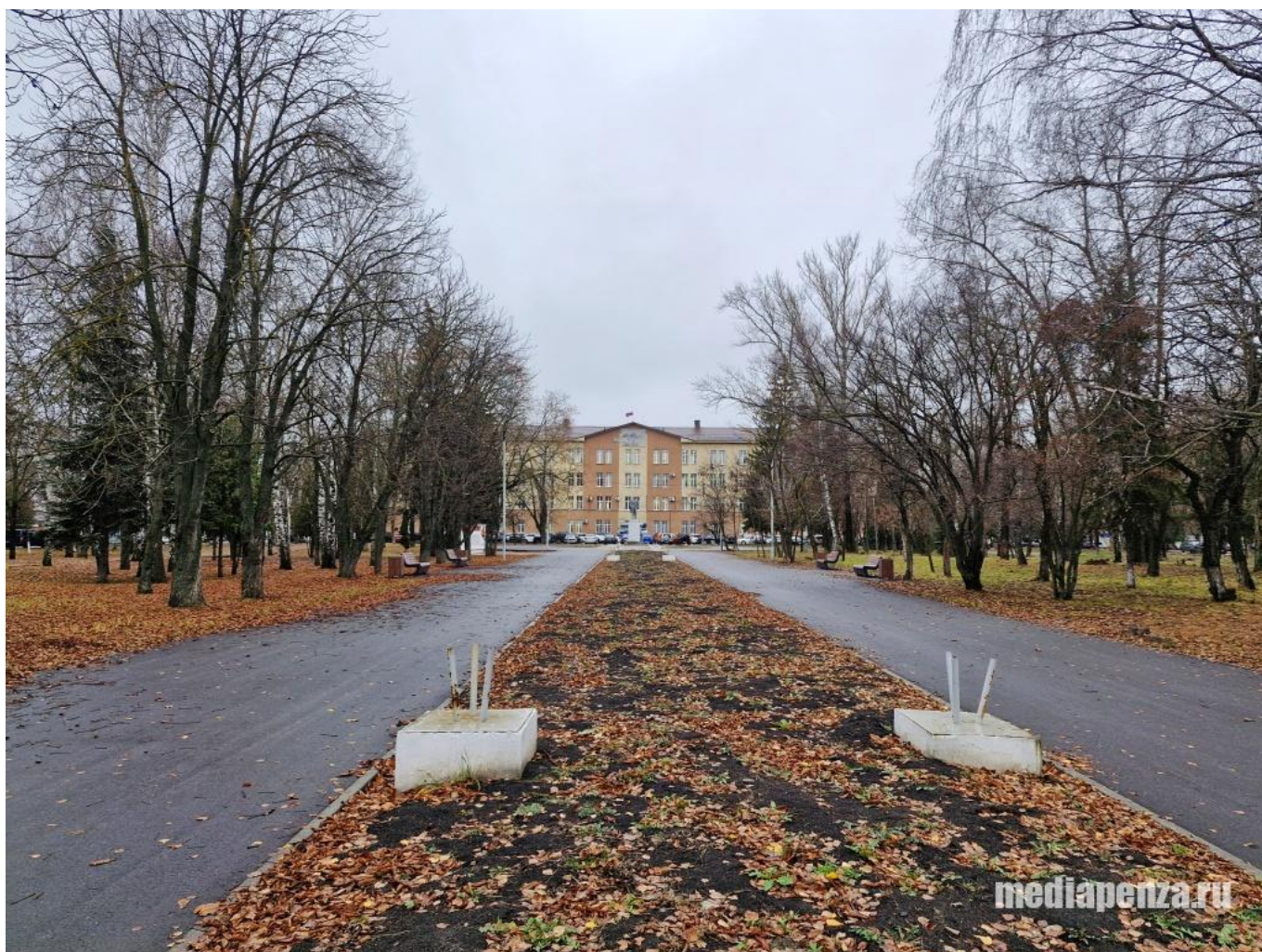
Сквер у Дизельного завода на Южной Поляне. Частично приведён в порядок в 2024 году.