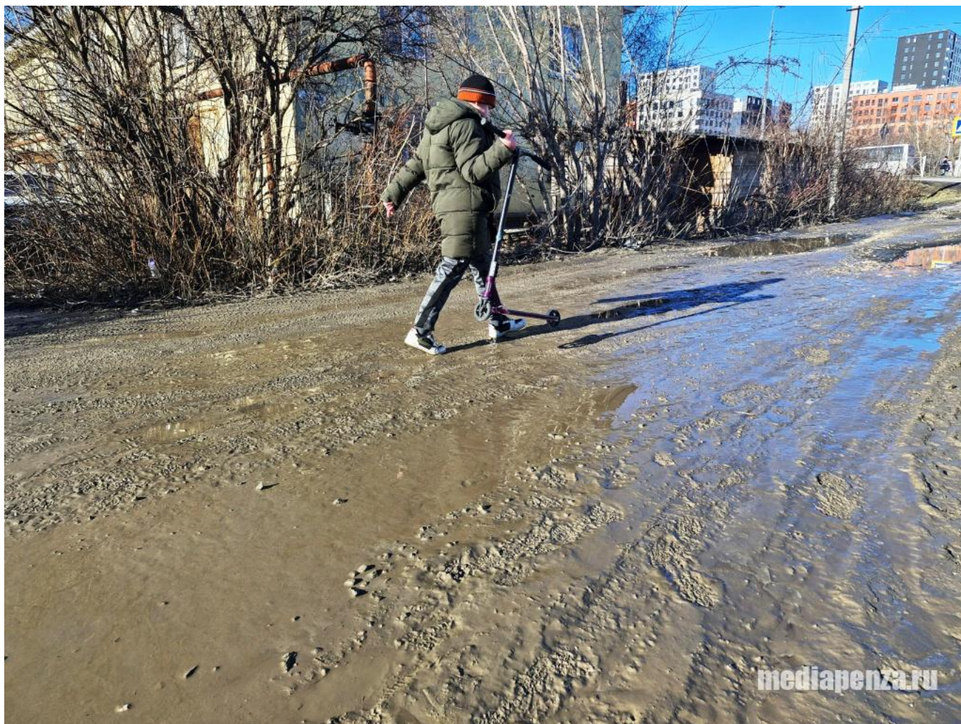
Дорога на улице Измайлова в марте 2025 года.

«Договорились с застройщиками, что в случае необходимости, они будут оперативно подсыпать дорогу, не дожидаясь возмущения жителей. Надеюсь, что к этой проблеме мы больше возвращаться не будем», – писал председатель Думы 14 марта.