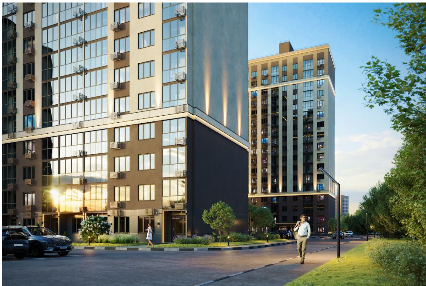
Эскиз проекта ЖК «Стрижи».

Напомним, что ранее МедиаПенза опубликовала материал о ЖК «Династия», строящейся компанией «Пензгорстройзаказчик» в рамках программы КРТ на улице Измайлова, который эксперты называют одним из худших жилищных комплексов в Пензе.