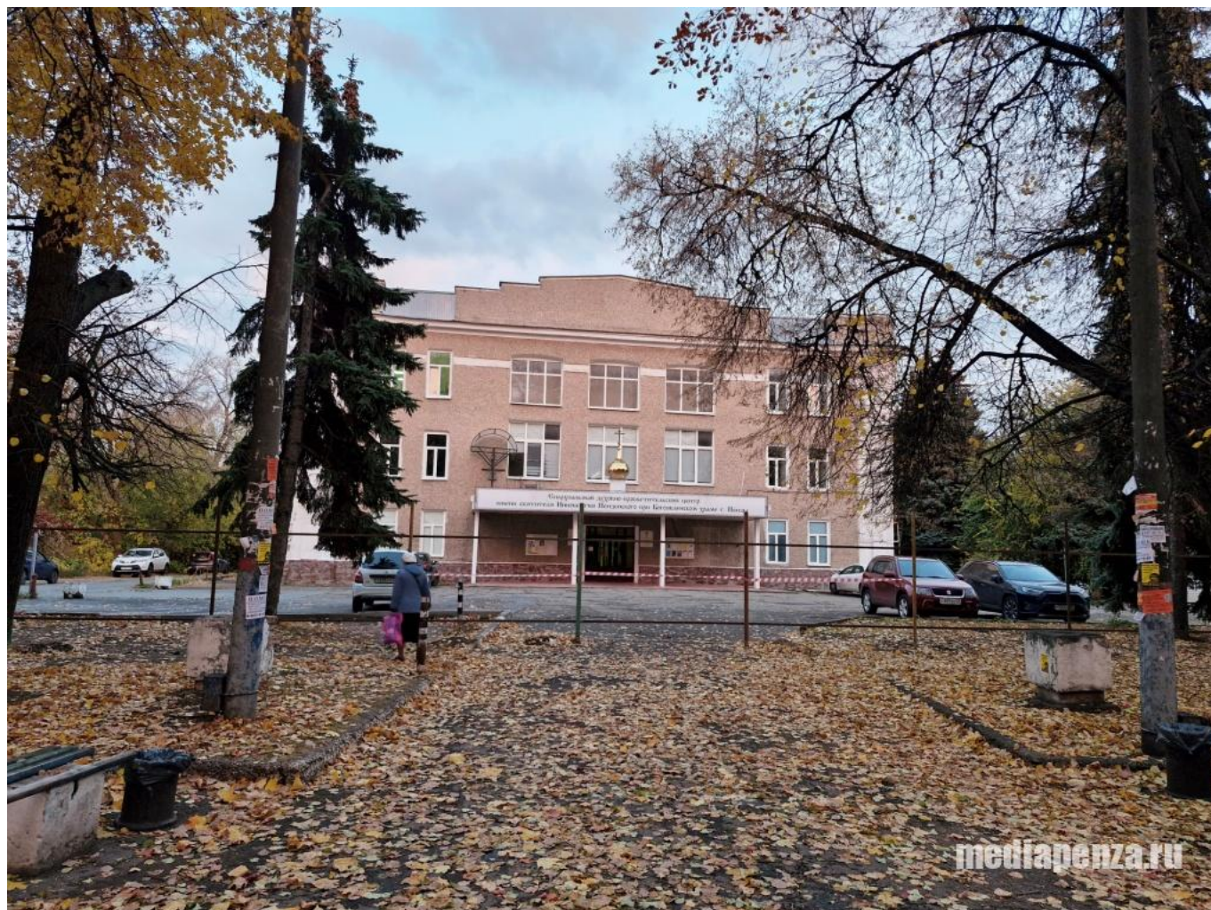
Духовно-просветительский центр РПЦ в здании бывшего Дворца культуры.