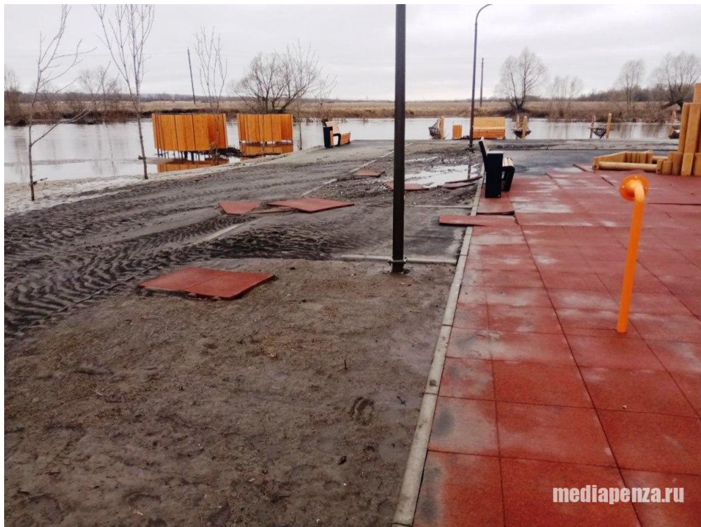
Зона отдыха «Садки». Стоимость работ более 90 млн рублей.

«В лежаках скопились плывущие по разлившейся реке кусты и грязь. Резиновое покрытие смыло водой. Грязная река вошла в берега, вновь превратившись в ручей с плывущему по нему отходами. А коммунальные службы убрали грязь только после многочисленных жалоб и возмущений горожан», – сообщает жительница города.