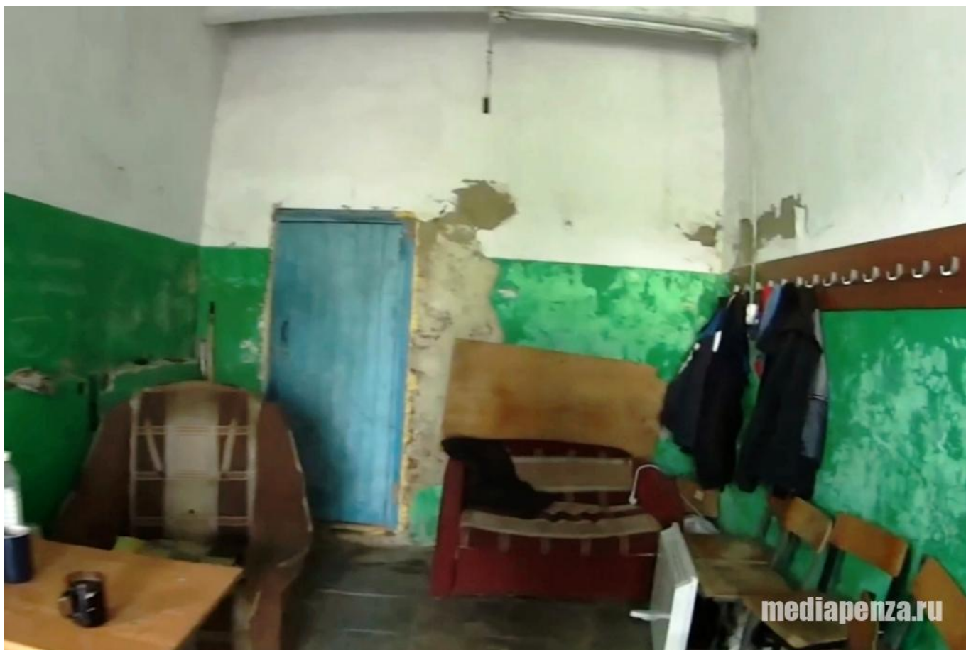
Раздевалка на стадионе «Труд»

На стадионе есть и туалет, который закрыт на ключ, так как к нему не подведено водоснабжение. Для посетителей был установлен биотуалет, к которому опасно приближаться из-за его вида и запаха.