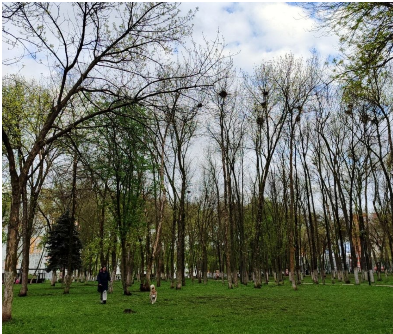
Ясени в Ульяновском парке

Надежда на «оживление» деревьев есть – в Москве частично удалось спасти ясени, которые были сильно поражены златкой в 2007-2013 г.г., и тогда уже выглядели безнадежными. Кроме того, из спиленных пней начинает расти поросль восстановления. Львов поделился своими фотографиями, сделанными по дороге в Ухтинку. На них видно, что засохшие ясени стали давать поросль в нижней части ствола.